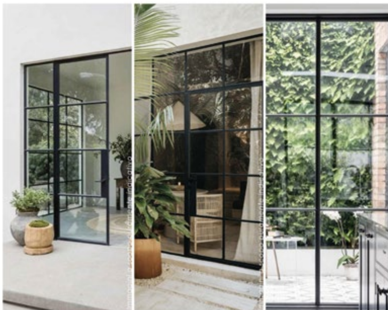
Immagine a scopo puramente illustrativo This image is for illustrative purposes only