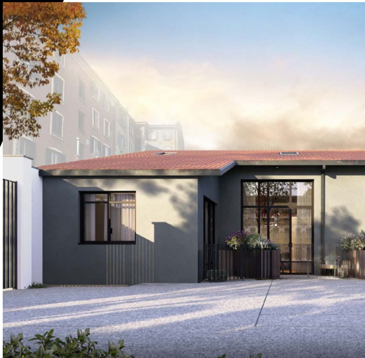
Immagine a scopo puramente illustrativo This image is for illustrative purposes only

In Via dell'Aprica 8, the heart of the Farini district, is undergoing the construction of a unique loft that is characterized by a modern and industrial style. The layout of the residence recalls that of a terraced house, offering independence and comfort in a lively and constantly evolving urban context.