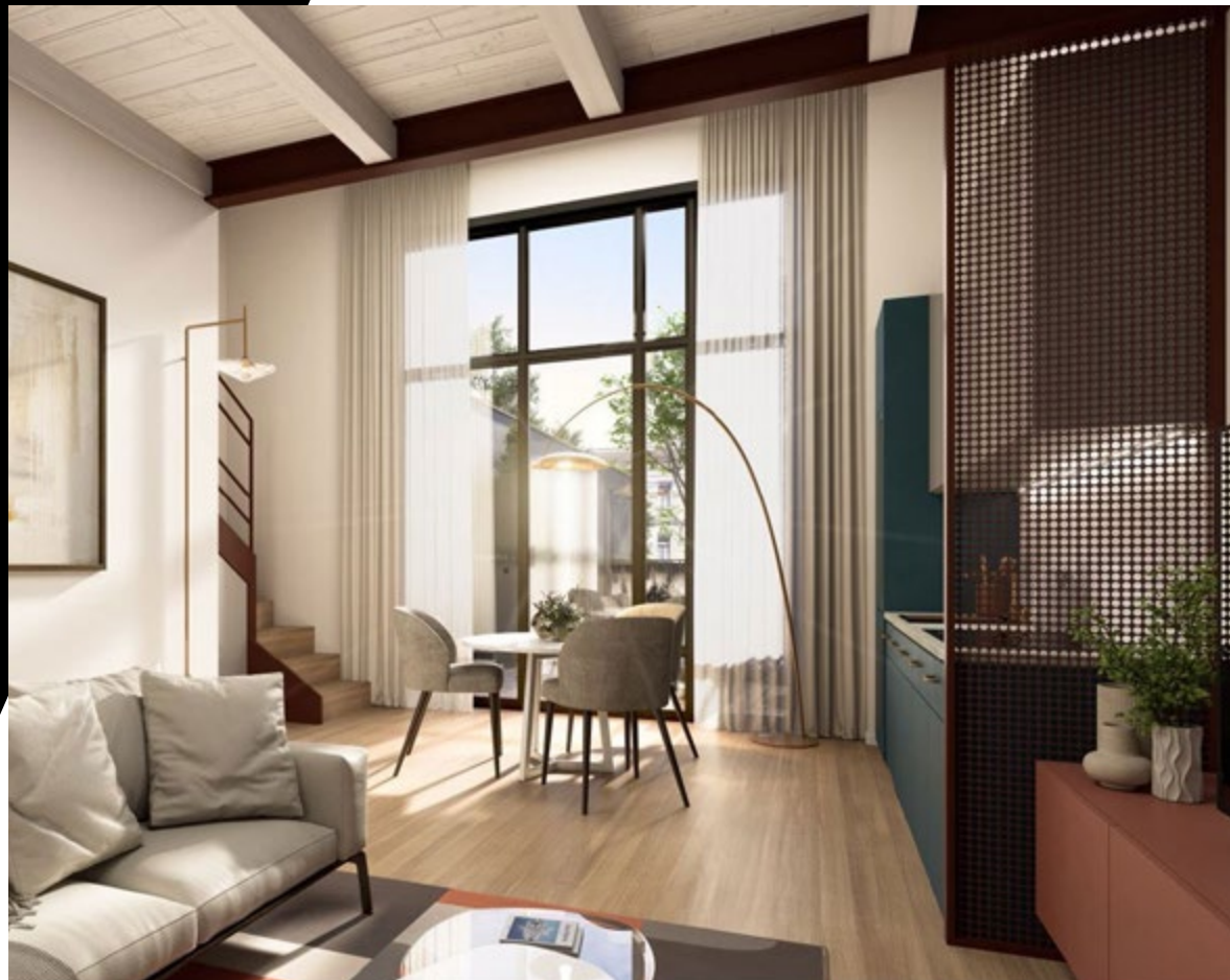
Immagine a scopo puramente illustrativo This image is for illustrative purposes only