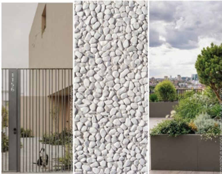
Ambience. Texture. Materials.