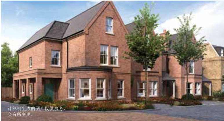
计算机生成的图片仅供参考，会有所变更。