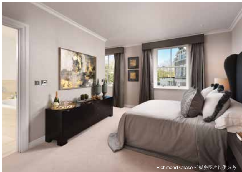
Richmond Chase 样板房图片仅供参考