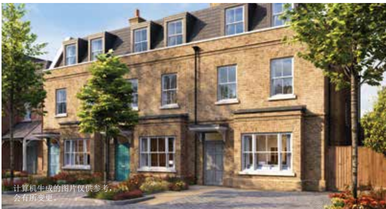
计算机生成的图片仅供参考，会有所变更。