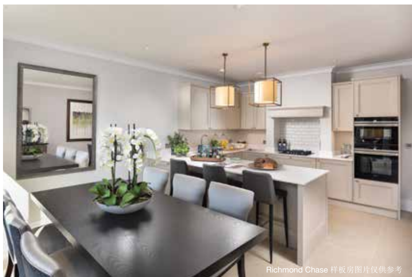
Richmond Chase 样板房图片仅供参考