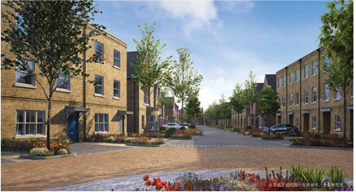
计算机生成的图片仅供参考，会有所变更。