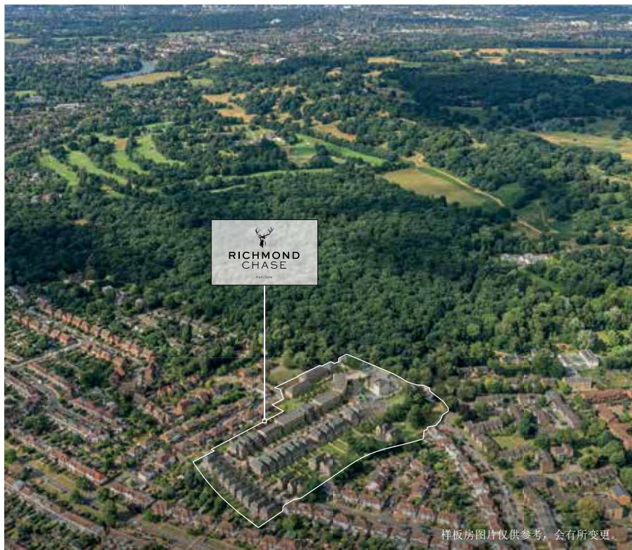
样板房图片仅供参考，会有所变更。